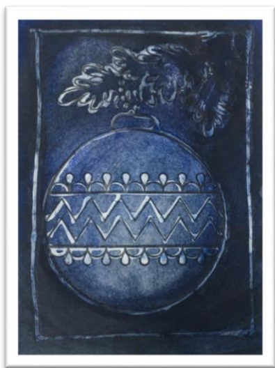
Фото с мастер-класса