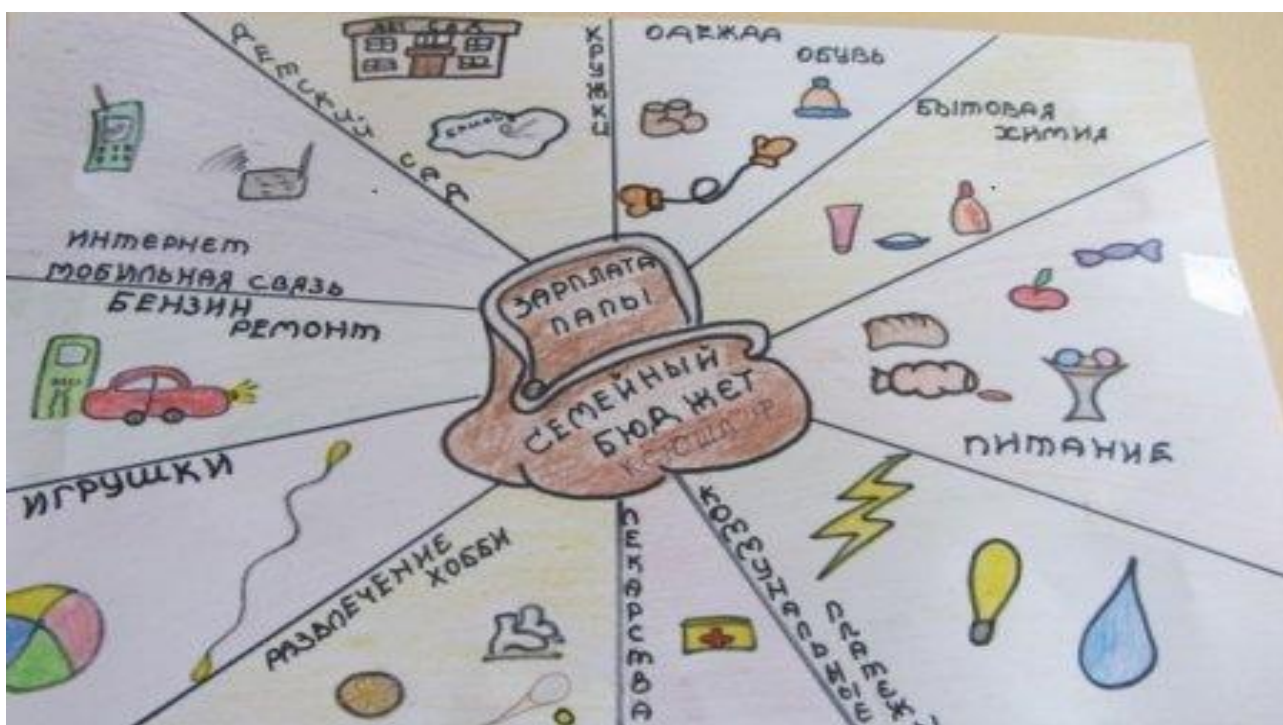
Рисунок 2. – Графическое отображение статей расходов семьи

размещаем на доске, анализируем и совместно делаем выводы, на что в основном семьи тратят деньги.