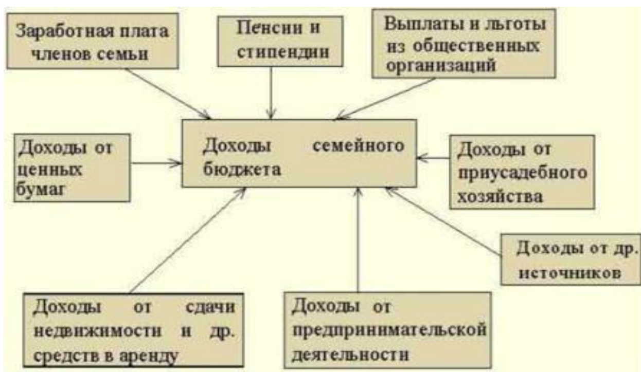
Рисунок 1. – Доходы семейного бюджета

Какие виды доходов семьи вы можете назвать, ответы детей закрепляем в виде схемы.